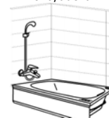
Figura 3: Monomando ó Combinación tina/ducha

NOTA: Si la bañera es desplazada desde uno o ambos muros en la instalación, considere la distancia en las cotas indicadas.