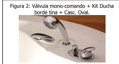
Figura 2: Válvula mono-comando + Kit Ducha borde tina + Casc. Oval.

B Arranques de agua fría/caliente (terminales de 1/2 pulg. Hilo Interior). Si su bañera, está equipada con grifería jacuzzi (Válvula Monocomando) y cascada de llenado, ver figura 2. La conexión entre estos accesorios se realiza previamente, en fábrica. Para la conexión definitiva, una vez instalada la bañera, se sugiere utilizar terminales flexibles entre arranques y grifería.