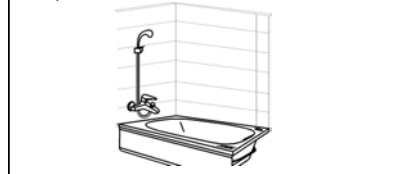
Figura 3: Monomando ó Combinación tina/ducha

NOTA: Si la bañera es desplazada desde uno o ambos muros en la instalación, considere la distancia en las cotas indicadas.