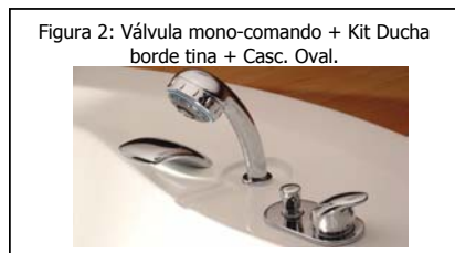
Figura 2: Válvula mono-comando + Kit Ducha borde tina + Casc. Oval.

Arranques de agua fría/caliente (terminales de 1/2 pulg. Hilo Interior). Si su bañera, está equipada con grifería jacuzzi y cascada de llenado, (ver figura 2). La conexión entre estos accesorios es realizada previamente, en fábrica. Para la conexión definitiva, una vez instalada la bañera, se sugiere utilizar terminales flexibles entre arranques y grifería.