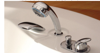
Figura 2: Válvula mono-comando + Kit Ducha borde tina + Casc. Oval.

Para la conexión definitiva, una vez instalada la bañera, se sugiere utilizar terminales flexibles entre arranques y grifería.