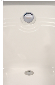
Figura 1: Conjunto Desagüe Rebalse Remoto.